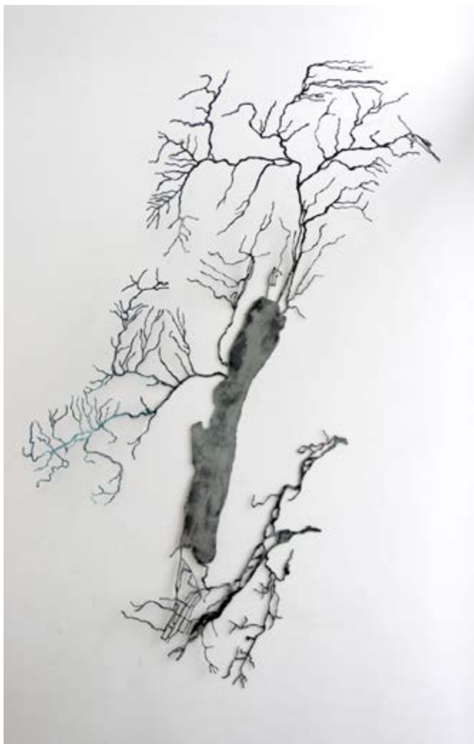
Le beau lac (Lac du Bourget) - Acier verni, 130 x 100 x 40 cm 2016