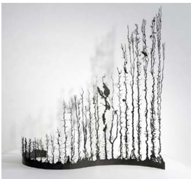
Tous les fleuves - Acier patiné, 71 x 25 x 76 cm, 2017