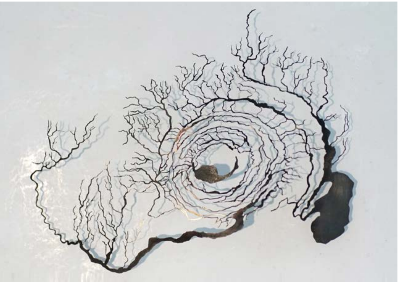
L'œil de l'Afrique (Richât) - Laiton patiné, 36 x 36 x 5 cm, 2017

J'expérimente également d'autres techniques à partir de dessins digitaux qui sont découpés au laser ou chimiquement, en fonction de la dimension souhaitée, et qui permettent de réaliser de petites séries.