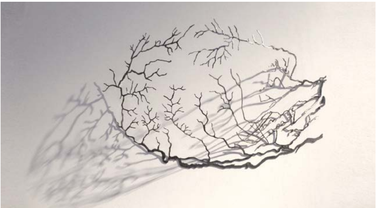
La montagne de lait (Molkenrain) 2 - Acier verni, 76 x 43 x 22 cm, 2016

Par ses diverses expériences sculpturales, l'artiste incite le spectateur à contempler différemment le paysage, à naviguer dans des espaces imaginaires. Ses sculptures invitent à de multiples parcours.