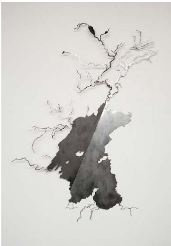
La grande faille (Thingsvellir) - Acier verni, 75 x 7 x 117 cm, 2017