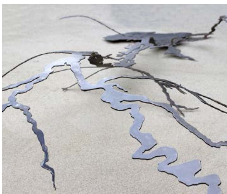
Somme - Acier patiné et verni, 320 x 150 x 25 cm, 2016